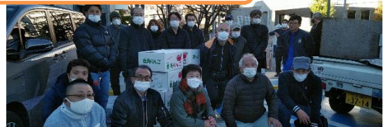
葛飾区浴場組合の皆さんより、りんごのご寄付