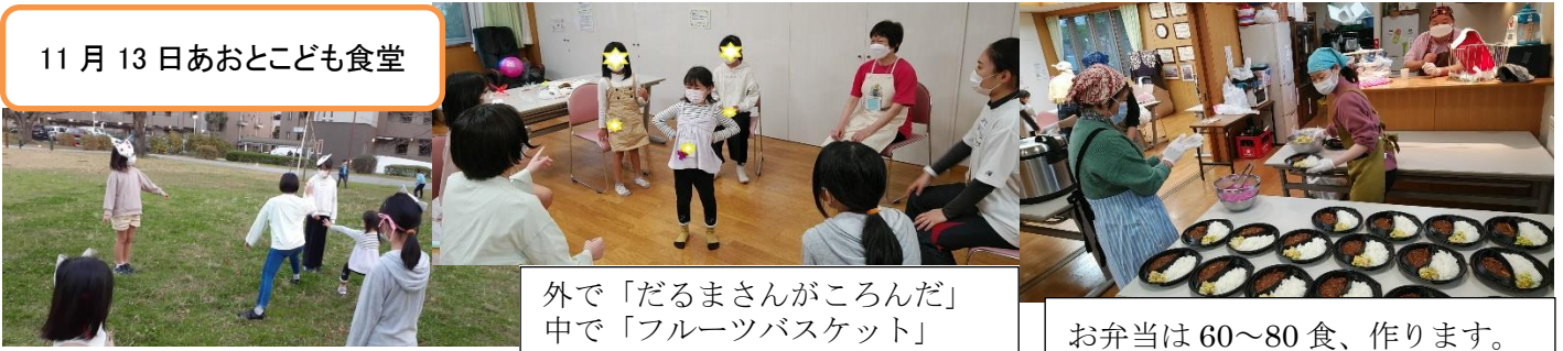
外で「だるまさんがころんだ」 中で「フルーツバスケット」