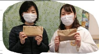
「PAUL」レアールパスコベーカリーズ。規格外フルーツを使った商品売り上げの一部ご寄付。