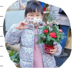
葛飾ろう学校の皆 さん手作りのクリ スマスツリー