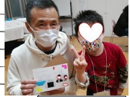
ありがとう のお手紙