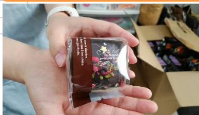
葛飾ろう学校の生徒さんたちが作ってくれた焼き菓子