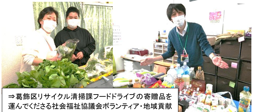
⇒葛飾区リサイクル清掃課フードドライブの寄贈品を運んでくださる社会福祉協議会ボランティア・地域貢献活動センターのスタッフ