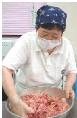
第2回 調理ボランティア

※「調理」と「送り」のボランティアがいます。送りボランティアは食事会終了後、子どもを家まで送り届けます。食事会では無口な子が、送りボランティアにはいろいろなことをお喋りしてくれるんです。