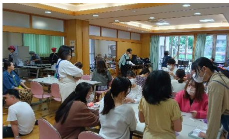
あおとこども食堂の遊びコーナーはこのところ混みこみです(^.^;)

私たちはきっと、ずっと、こうして笑顔でつながっていくんだな〜と、今からワクワク楽しみです(^.^)