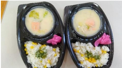
サーモンシチュー弁当

4月7日、葛飾区の立石さくら祭りでおもちゃ作家さんが「おもちゃ100円くじ」を企画。売り上げの4万円全額をあおとこども食堂に寄付してくださいました。